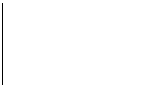
Место для подписи

Примечание: подпись должна: размещаться в центре «места для подписи», иметь четкие, хорошо различимые линии, ставиться черными чернилами, занимать 80% выделенной области и не выходить за пределы рамки.